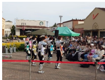
NASU GARDEN OUTLET 那須ガーデンアウトレット