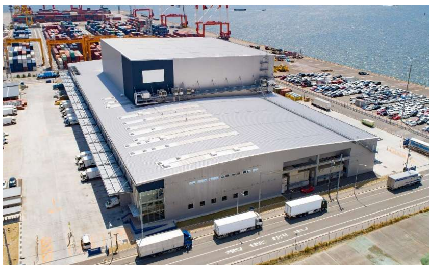
六甲アイランド DC 外観