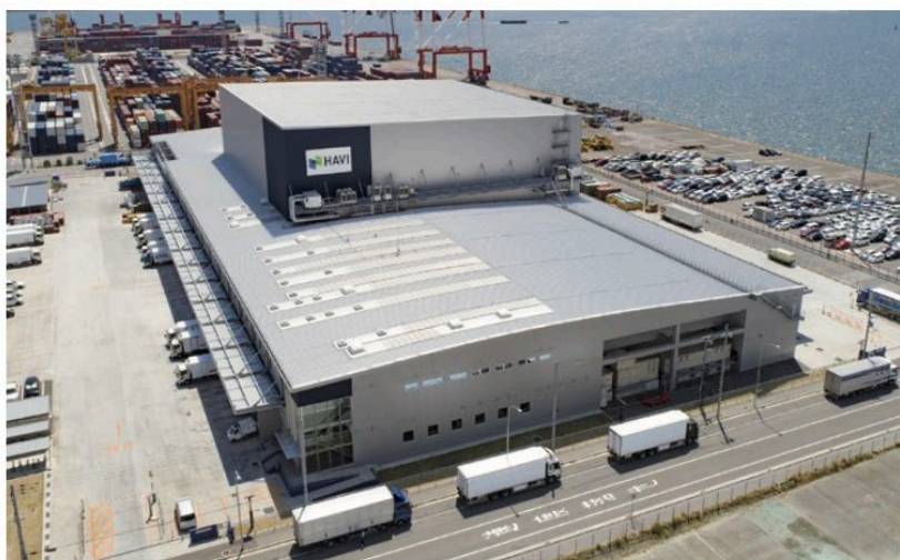
六甲アイランドDC外観